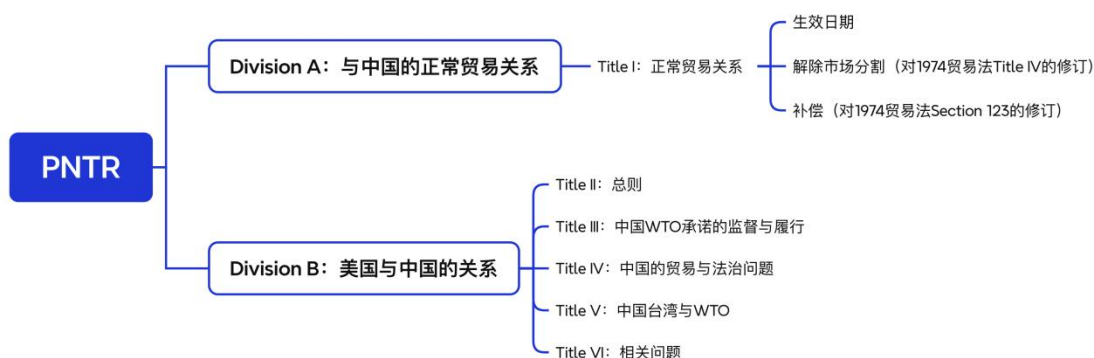
图 2 美国授予中国永久正常贸易关系（PNTR）法案大纲

最终，美国政府决定通过 PNTR，以确保能够从中国加入 WTO 的机会中获益。2000 年，美国国会审议通过了授予中国 PNTR 的相关立法。PNTR 的生效意味着中国享有的最惠国待遇不再需要每年重新审查，标志着中美贸易关系的稳定与长期化。