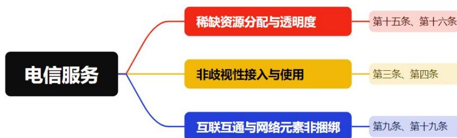
图 2 电信服务章节

2023年《议定书》增设第十八章“电信服务”，纳入电信资源分配、电信接入和使用、互联互通、号码携带、转售、网络元素非捆绑等高水平条款，确保双方服务提供者能够以合理、非歧视和透明的方式接入和使用公共电信网络服务。