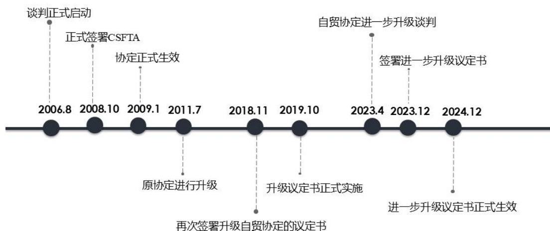
图1 中新自由贸易协定谈判时间轴

2020年12月8日，双方宣布启动中新自贸协定进一步升级后续谈判。经过近三年的磋商与谈判，中国与新加坡在2023年4月1日宣布已实质性完成自由贸易协定升级的后续谈判，并签署了相关的谅解备忘录。这一进展意味着双方就自由贸易协定的进一步升级达成了共识，并为协议的最终签署和生效奠定了坚实基础。2024年12月31日，《中华人民共和国政府和新加坡共和国政府关于进一步升级〈自由贸易协定〉的议定书》正式生效。